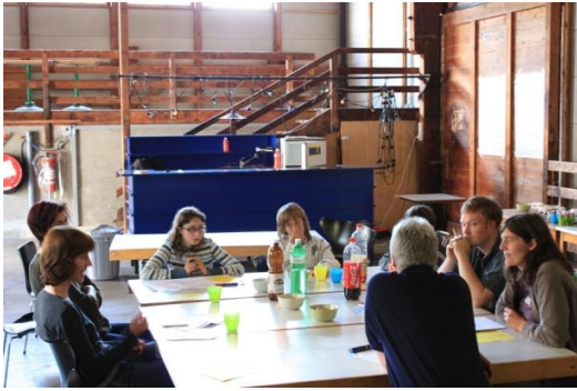
Jugendmitwirkungstag in Burgdorf

Die ersten zwei Juliwochen stehen im Zeichen des Burgdorfer Ferienpasses. Wir bieten erneut den bereits schon traditionellen Kurs „Disco selbstgemacht“ an, welcher mit einer Jugenddisco zu Ende geht.