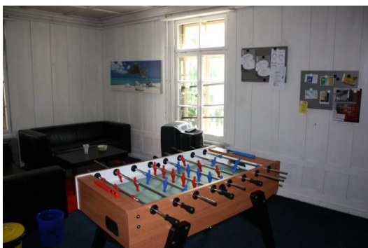
Gemüts-Ecke im Maison Pierre

Die Räumlichkeiten im Maison Pierre werden im Februar den Bedürfnissen der Jugendarbeitenden und der Jugendlichen entsprechend eingerichtet. Nebst einem Büro für die Jugendarbeitenden (Informationszentrale), gibt es ein Sitzungszimmer (Palaverraum) und einen Aufenthaltsraum für die Jugendlichen (Gemüts-Ecke).