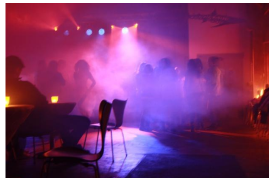
Christmas Party im Kulturschopf

Mit Blick aufs nächste Jahr werden im November Mitglieder fürs Organisationskomitee von Modi- und Giewälte 2010 gesucht. Im Jugendtreff in Krauchthal führen wir einen Kinoabend durch.