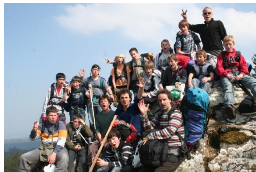
Abenteuer-Ferientage für Giele

Während den Frühlingsferien im April beginnt die Umgestaltung des Jugendraums Chillhouse. Gemeinsam mit Jugendlichen wird umgeräumt und neu gestrichen. Der zweite Teil der Aktion, sprich der neue Boden und eine neue Aussenmauer, erfolgt später im Jahr. An den Abenteuer-Ferientagen für Giele der Fachgruppe Gielearbeit der VOJA (Vernetzte offene Kinder- und Jugendarbeit Kanton Bern) nehmen einige Jungs aus unserem Einzugsgebiet teil. Direkt nach den Ferien ist „dr fahrend Schpiuplatz“ wieder bis zum Herbst an den Mittwochnachmittagen im Einsatz. Des Weiteren sind wir im Rahmen der aufsuchenden Jugendarbeit regelmässig in Hindelbank und Krauchthal unterwegs.