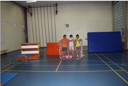
Halle für Alle in Hindelbank

Im August gehen wir online: Die Website www.burgdorf.ch/jugendarbeit wird aufgeschaltet. Kurz darauf eröffnen wir Profile in Facebook und Netlog (Jugendarbeit Burgdorf). Ausserdem stellen wir uns erneut den neuen 7. Klassen vor.