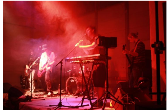
Konzert im Kulturschopf

Der September zeichnet sich durch verschiedene Einzelveranstaltungen aus: In Hindelbank führen wir das Angebot „Halle für Alle“ durch. Am kantonalen Tag der offenen Kinder- und Jugendarbeit findet im Kulturschopf ein Jugendkonzert statt und am 18. September beenden wir das Quartal mit dem jährlichen Treff-Fest.