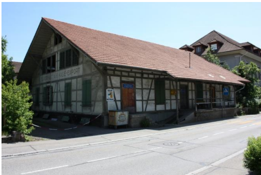
Maison Pierre an der Scheunenstrasse 3

Das Januarloch ist für die JuBU kein Thema. Wir sind damit beschäftigt, unsere neuen Räumlichkeiten im Maison Pierre an der Scheunenstrasse 3 in Burgdorf zu beziehen. Gleichzeitig führen wir die regelmässigen Angebote des Vorjahres weiter: Pausenplatzaktionen an den Oberstufenschulhäusern, Modi-, Giele- und Jugendtreff im Chillhouse sowie die Mädchentanzgruppe roundabout.