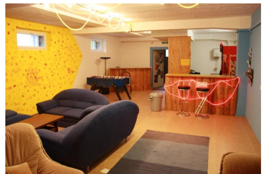
Jugendraum Chillhouse im Kulturschopf

Der Oktober steht ganz im Zeichen von Jugend Mit Wirkung. In Krauchthal findet der dritte Jugendmitwirkungstag statt und am Infoabend in Hindelbank melden sich erste Interessierte für ein Organisationskomitee.